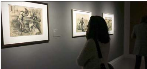
El pintor holandés retrató las difíciles condiciones de vida de los mineros y campesinos de Borinage, faceta que actualmente se exhibe en la ciudad belga de Mons.