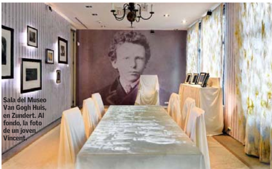
Sala del Museo Van Gogh Huis, en Zundert. Al fondo, la foto de un joven Vincent.