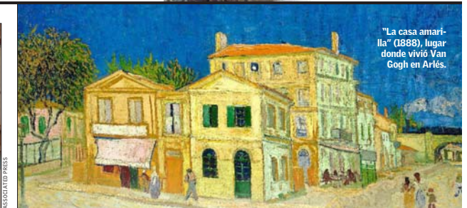
"La casa amarilla" (1888), lugar donde vivió Van Gogh en Arlés.

acuarelas y naturalezas muertas—"Los pobres y el dinero" (1882) y "Naturaleza muerta con col y zuecos" (1881)—, alentado por su primo, el pintor realista Anton Mauve. 70 kilómetros al noreste de La Haya, está Ámsterdam, el lugar del mundo en que se concentra la mayor cantidad de obras de Van Gogh, en el museo que lleva su nombre. En la capital holandesa se organizarán diversas actividades conmemorativas, entre ellas la muestra "Munch/Van Gogh", que mostrará la afinidad artística entre ambos pintores, a través de más de un centenar de obras.