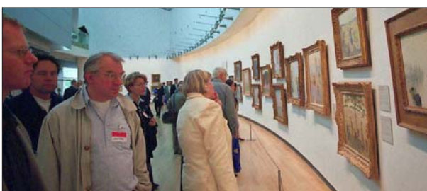
El Museo Van Gogh de Ámsterdam ha vivido varias remodelaciones. Allí se concentra la mayor cantidad de obras del prolífico pintor holandés en el mundo, entre dibujos y pinturas.