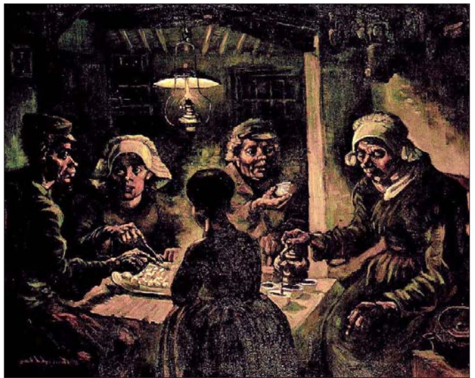
"Los comedores de patatas" (1885) fue calificado en su tiempo por Van Gogh como "lo mejor que he hecho". Corresponde a una etapa oscura y realista, en que plasma con su pincel las vidas de los campesinos.