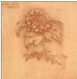
La sanguina es una tiza compuesta de hematita ferruginosa, color rojo anaranjado.

El bistre es tanino disuelto en agua, se le obtiene hirviendo hollín; de una tinta amarillenta